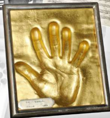
UNA DELLE IMPRONTE DEL MUSEO CON COPERTURA IN FOGLIA D'ORO