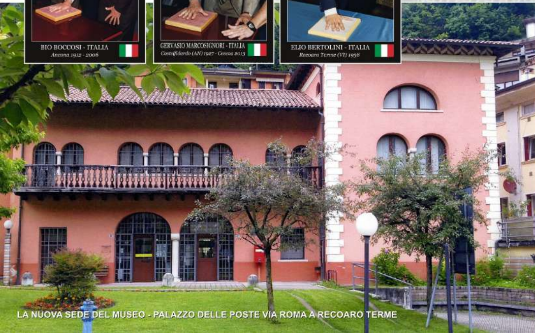
LA NUOVA SEDE DEL MUSEO - PALAZZO DELLE POSTE VIA ROMA A RECOARO TERME